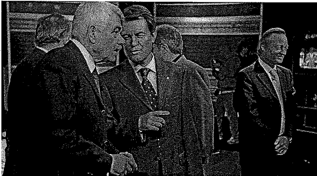
Artur Mas conversa con Pasqual Maragall, poco antes del inicio del debate, en presencia del resto de los candidatos