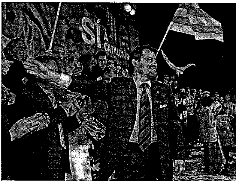
Mas hizo ayer campaña en Lleida, donde almorzó con un millar de jóvenes y celebró un mitin

Mas pasó la jornada en Lleida donde a mediodía almorzó con cerca de un millar de jóvenes. Aprovechando este auditorio, miró también hacia la franja de electores que se disputa con el PSC y se presentó como el verdadero candidato de la "renovación y el cambio". Por ello, consideró que el 16-N Catalunya también se juega "si el país será dirigido por una nueva generación o