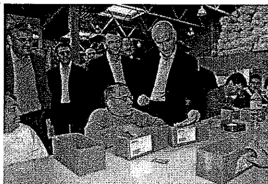
Duran, ayer, en un centro de trabajo para discapacitados en Reus

ciones del candidato popular, que afirmó que CiU corre el riesgo de no ser útil ni en la política catalana ni en la española. Duran añadió que "hemos sido importantes y lo seguiremos siendo". El dirigente de CiU dudó de la capacidad política de Piqué al afirmar que "todo el mundo sabe que hemos hecho cosas por Catalunya que Piqué no ha podido hacer" y reclamó el voto para CiU porque después de las elecciones "continuaremos siendo un partido central, centrado y que garantiza la tranquilidad".●