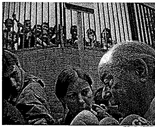
Pujol visitó ayer el barrio de La Florida de l'Hospitalet

ni PPC ni PSC están en condiciones de defender la autonomía de Catalunya porque las dos formaciones dependen de partidos de Madrid. En una visita a l'Hospitalet, se refirió a la demanda del líder de ERC de firmar un documento por escrito antes de pactar con una fuerza política después de las elecciones; Pujol recordó que "ERC pactó en 101 municipios después de las municipales con el PSC y no creo que hubiesen firmado nada. Que lo digan ahora significa que la experiencia del pacto no debe ser muy buena".